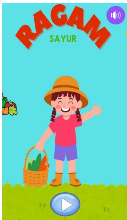
Gambar 3 Halaman Awal