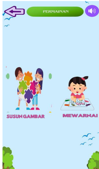
Gambar 6 Permainan Utama