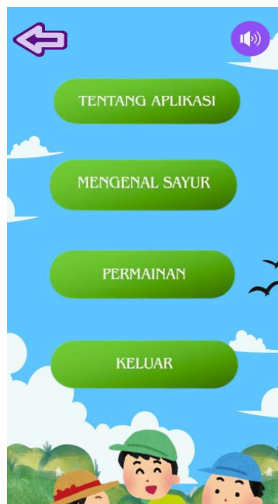
Gambar 4 Halaman Main Menu

Gambar 3 menunjukkan halaman mulai aplikasi RAGAM SAYUR yang merupakan tampilan awal yang diperlihatkan kepada pengguna sebelum masuk ke halaman menu. Pada halaman ini terdapat tampilan judul aplikasi dengan huruf yang jelas dan menarik sehingga dapat dibaca oleh anak-anak sebagai pengguna. Selanjutnya, terdapat tombol utama yang berbentuk lingkaran dengan gambar segitiga yang berguna sebagai tombol mulai untuk dapat masuk ke halaman selanjutnya.