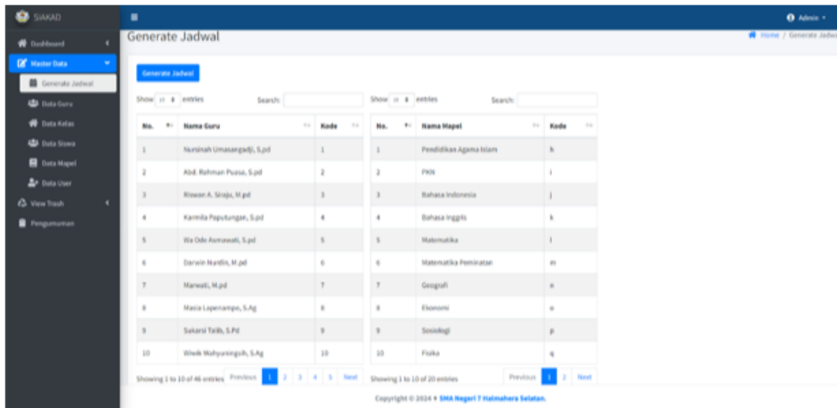
Gambar 2a Halaman Generate Jadwal