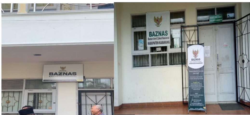
Gambar 1: BAZNAS Kabupaten Karawang 2024

( https://baznas.go.id/assets/images/szn/statistik_9.pdf , 2023).