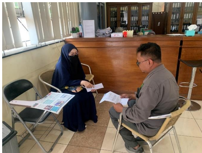
Gambar 2: Dokumentasi wawancara 2024

( https://kabkarawang.baznas.go.id/news-show/BaznasKarawangGelarRapatKoordinasi/1204.2024 )