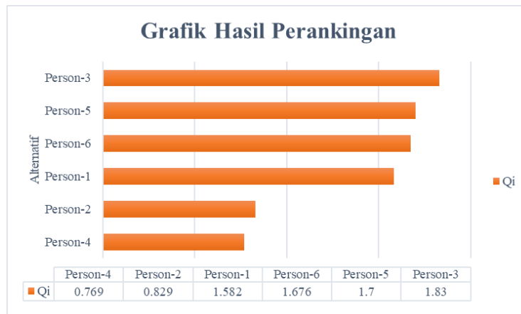
Gambar 2. Grafik Hasil Perankingan